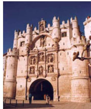
Arco de Santa María, Burgos

Del exterior destaca la armonía del conjunto de sus líneas, el remate de sus torres y torrecillas, las agujas (obra de Juan de Colonia del siglo XV) y el cimborrio (obra de Juan de Vallejo del siglo XVI).