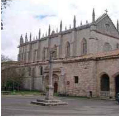
Cartuja de miraflores, Burgos

del artista Gil de Siloé: el retablo mayor, el sepulcro de los reyes Juan II e Isabel de Portugal y la estatua orante bajo arcosolio, del infante Alfonso, padres y hermano respectivamente de la reina Isabel la Católica