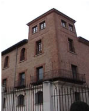
Palacio de Castilfale, Burgos

Del interior tiene especial interés la visita a capillas como la de los Condestables, Santa Ana, la Visitación, la escalera dorada..... También destacamos la visita al nuevo Museo Catedralicio localizado en diferentes capillas del Claustro en el que se muestra un gran conjunto del tesoro de la Catedral (orfebrería, tapices, pinturas...).