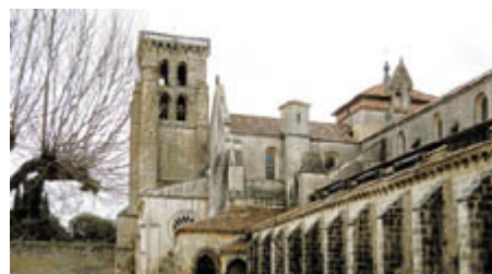
Monasterio las Huelgas, Burgos

No podemos dejar la ciudad sin visitar, el Real Monasterio de las Huelgas, fundación real del rey Alfonso VIII y Leonor de Inglaterra en el año 1187. Se encuentra en un lugar retirado de la ciudad, aunque próximo a la misma ya que reza una zona de descanso, de recreo, de "huelgo".